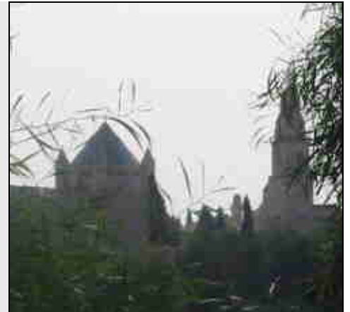
Dormitio Abtei auf den Zionsberg

Ausgewählte Bibelstellen zur Altstadt: Abendmahl: Mk 14,12-26; Lk 14,15-24; Mt 24,17-30; Joh. 13,21-26 Passionsgeschichte: Mt 27,1-66; Mk 15,1-47; Lk 23,1-56; Joh 19,1-42