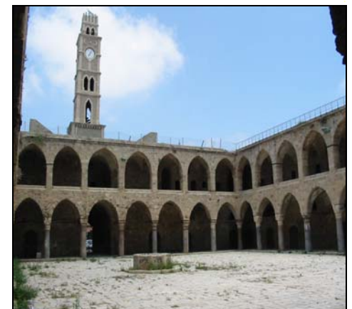
Akko – alte Karavanserei