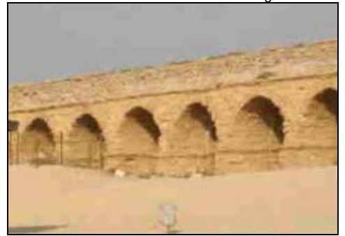
Caesarea am Meer