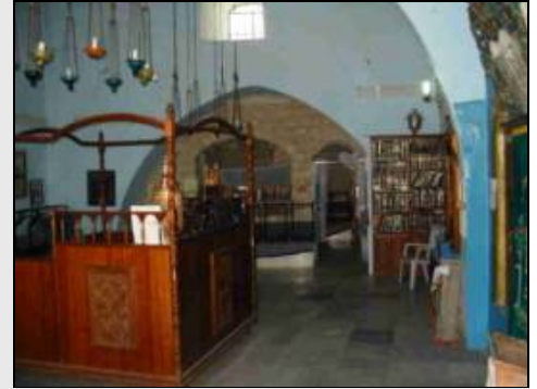
Safed, Josef Caro Synagoge