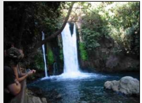
Wasserfall des Jordan